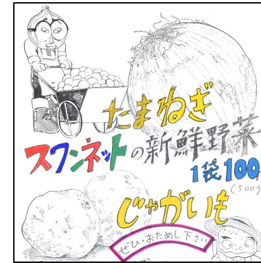
野菜販売 (じゃがいも・玉ねぎなど)