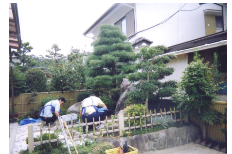
ボランティア精神と社会貢献として ピアサポーターによる『たすけあい活動』